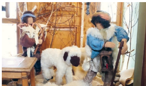
Kirche Bruder Klaus: Hirten unterwegs

Auch die Advents- und Weihnachtszeit forderte und förderte Flexibilität und Kreativität. In vielen Bereichen entfaltete sich Neues und die wenigen Begegnungen waren von spezieller Qualität geprägt. Erfreulicherweise waren wieder viele bereit, Adventsfenster zu gestalten, und unsere Sakristaninnen setzten mit Kreativität wandelnde Blickpunkte in den Kirchen. Je nach Thema konnte man sich mit inspirierenden Texten dazu vertiefen. Wer die Gelegenheit nutzte, bei einer Roratefeier, der Weihnachtsfeier für Kinder oder dem Weihnachtsgottesdienst am Heiligen Abend dabei zu sein, durfte hoffentlich lichtvolle Momente erleben und den Wert der achtsamen Begegnung neu erfahren. Wir sind glücklich über das Engagement von verschiedenen Leuten, die ihre Qualitäten einbringen und das Pfarreileben mitgestalten. «Gemeinsam sind wir Kirche!» Herzlichen Dank an alle, die mit ihrer Tatkraft all diese Anlässe ermöglichten!