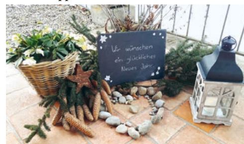
Kirche St. Verena: Silvester/Neujahr