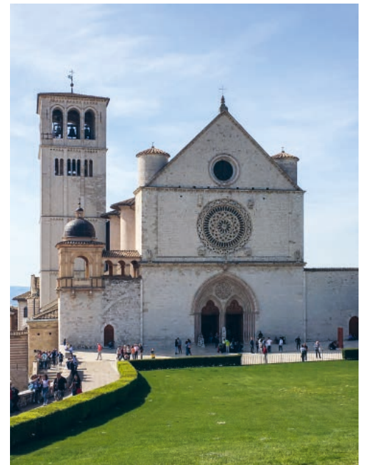
Oberkirche der Basilika San Francesco

Vom 16. bis 21. April weilen die jungen Erwachsenen, die sich auf dem Firmweg befinden, auf den Spuren von Chiara und Francesco in Assisi. Wir wünschen allen Teilnehmenden inspirierende Tage.